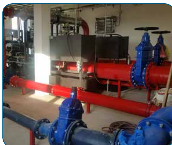
Motopompa tipo "vertical turbine pump" insonorizzata, realizzata secondo UNI EN 12845 Soundproof Fire fighting Diesel motor pump with "vertical turbine pump", made according to standard EN 12845 Motobomba Diesel contra incendio insonorizada con "vertical turbine pump", realizada en acuerdo de EN 12845